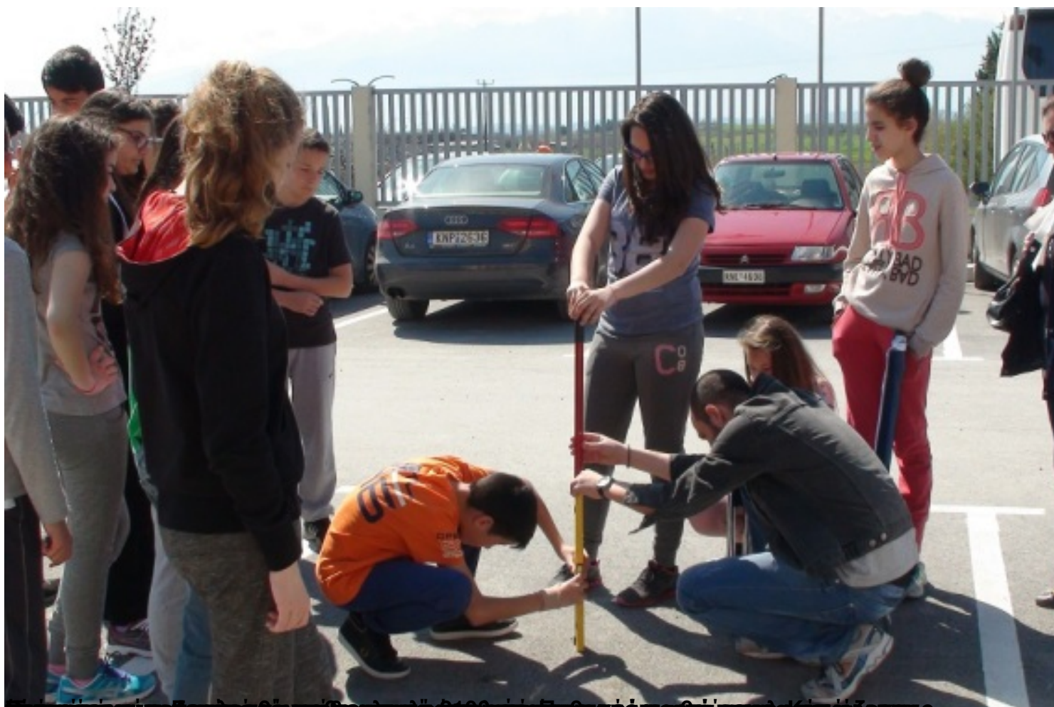
Εκπαιδευτές και μαθητές να πραγματοποιούν το πείραμα του Ερατοσθένη στα εκπαιδευτήρια Πλάτωνος.